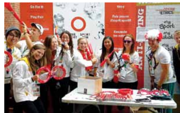
Cabine photographique Sport pur aux Jeux d'été du Canada de 2013 à Sherbrooke