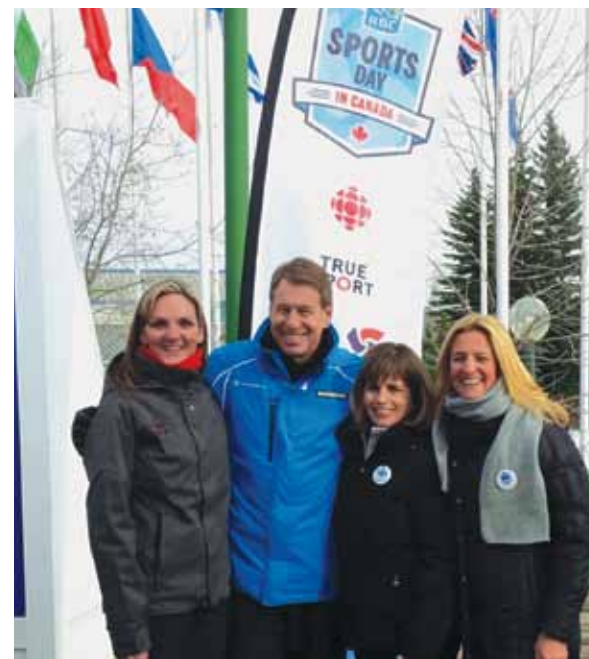
Tournée médiatique de la Journée du sport RBC au Canada

Reconnaissant que le sport sain peut faire une grande différence, la Société hôte des Jeux d'été du Canada a reconnu les Jeux d'été du Canada de 2013 à Sherbrooke comme étant un événement Sport pur. Les athlètes, les entraîneurs et les arbitres se sont engagés à adopter les principes Sport pur dans le cadre de la cérémonie d'ouverture. Un kiosque de renseignements Sport pur a également été installé dans le village des athlètes afin que les athlètes en apprennent davantage sur les initiatives sportives axées sur des valeurs. Les athlètes et les participants devaient relever le défi de prendre en photo leurs moments Sport pur préférés et de les partager.