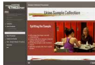
Une scène de Sport pur : l'ABC du sport sain