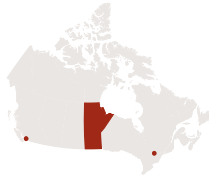
Carte du Canada avec les Provinces - Contour par FreeVectorMaps.com