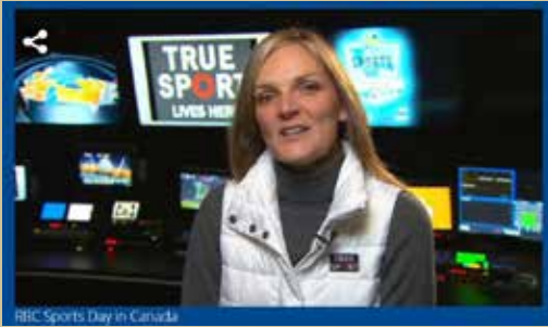
Sport pur participe à la diffusion de la Journée du sport RBC.

En novembre, plus de 800 000 Canadiens ont participé à plus de 2 000 événements sportifs enregistrés lors de la cinquième Journée du sport RBC et en ont fait l'édition la plus réussie à ce jour. Présentée par ParticipACTION, CBC et Sport pur, la Journée du sport est une célébration nationale annuelle du pouvoir du sport de renforcer la collectivité et de faire bouger les Canadiens. En tant qu'association d'experts en mobilisation du secteur des sports, Sport pur a encouragé tous les événements de la Journée du sport à adopter les principes du Sport pur.